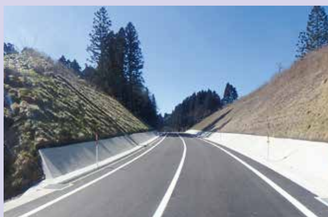
大田桜江線(大田市)