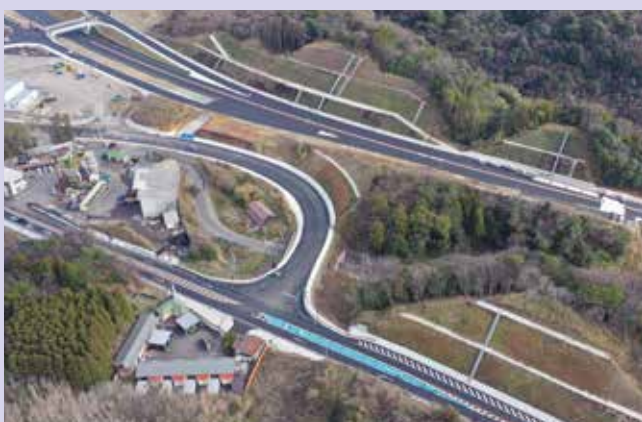
静間仁摩道路(大田市)