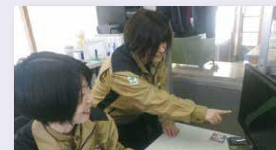
活躍する女性技術者