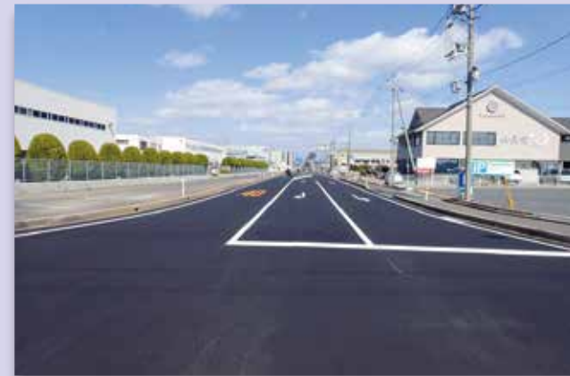
江島地区江島幹線(松江市)