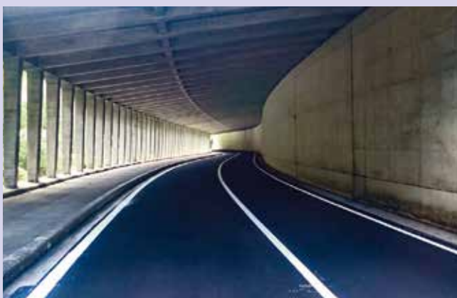
美郷飯南線(美郷町)