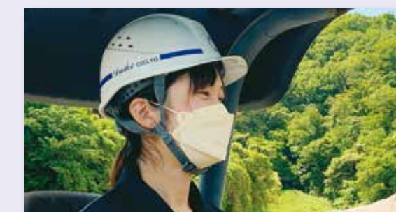
活躍する女性技術者