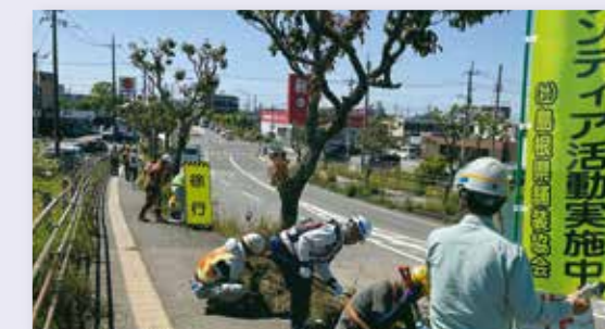
ボランティア活動の実施