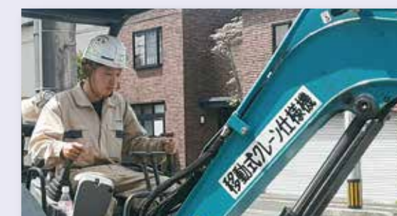
若手オペレーターの育成