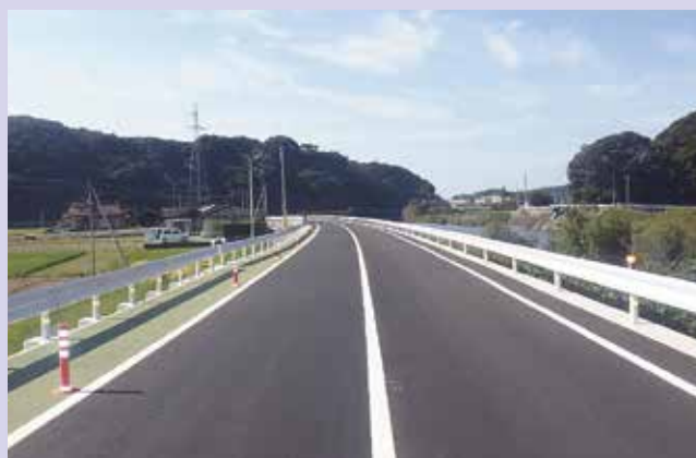
美川周布線(浜田市)