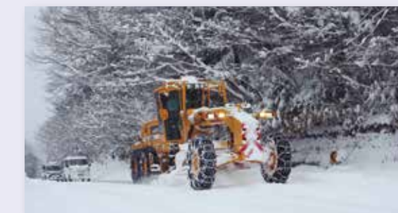
地域を守る除雪作業