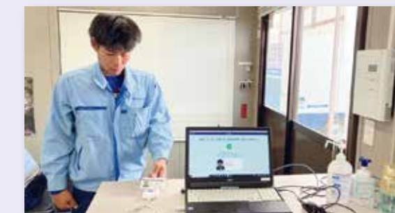
建設キャリアアップシステムの活用