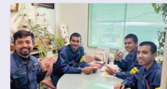
建設業で活躍する外国人技能者