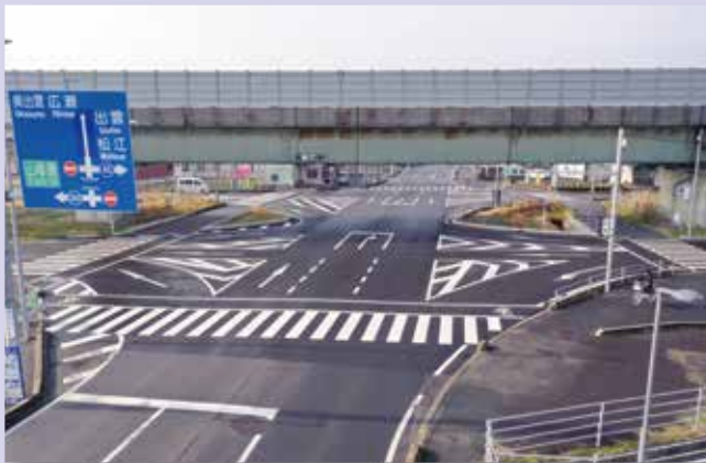
安来木次線(安来市)