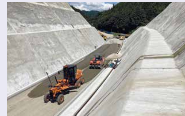
舗装協会員のICT活用舗装工事件数