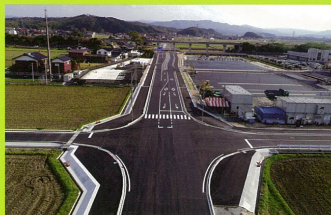
安来木次線(安来市)