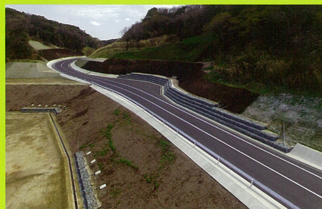
静間久手停車場線(大田市)