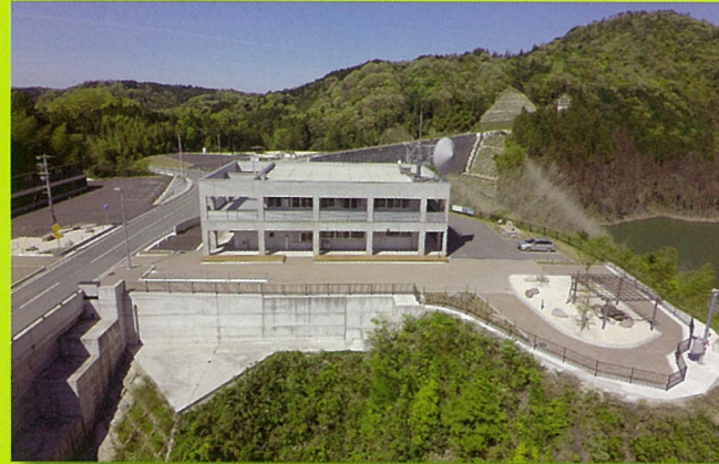
第二浜田ダム【かわらミック舗装】(浜田市)