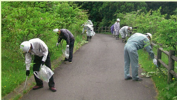
宍道ふるさと森林公園でのボランティア清掃活動