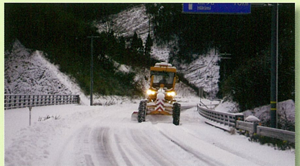
懸命の除雪作業で生活路線を守る