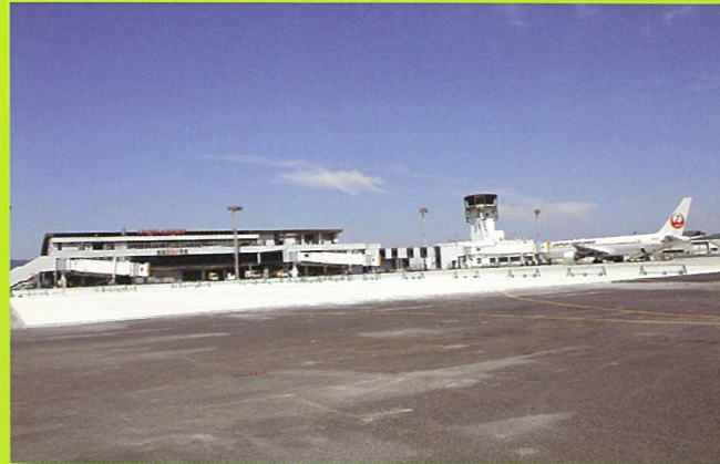
出雲空港エプロン(出雲市)