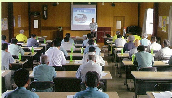
CPDS研修会(昨年10月の大田会場の様子)