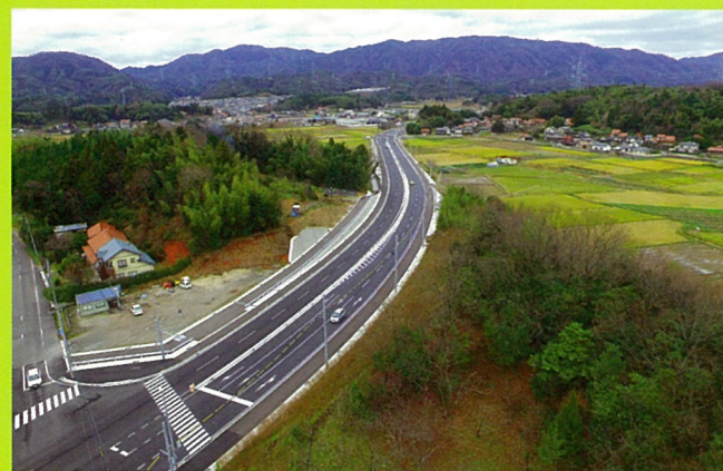
国道431号川津バイパス(松江市)