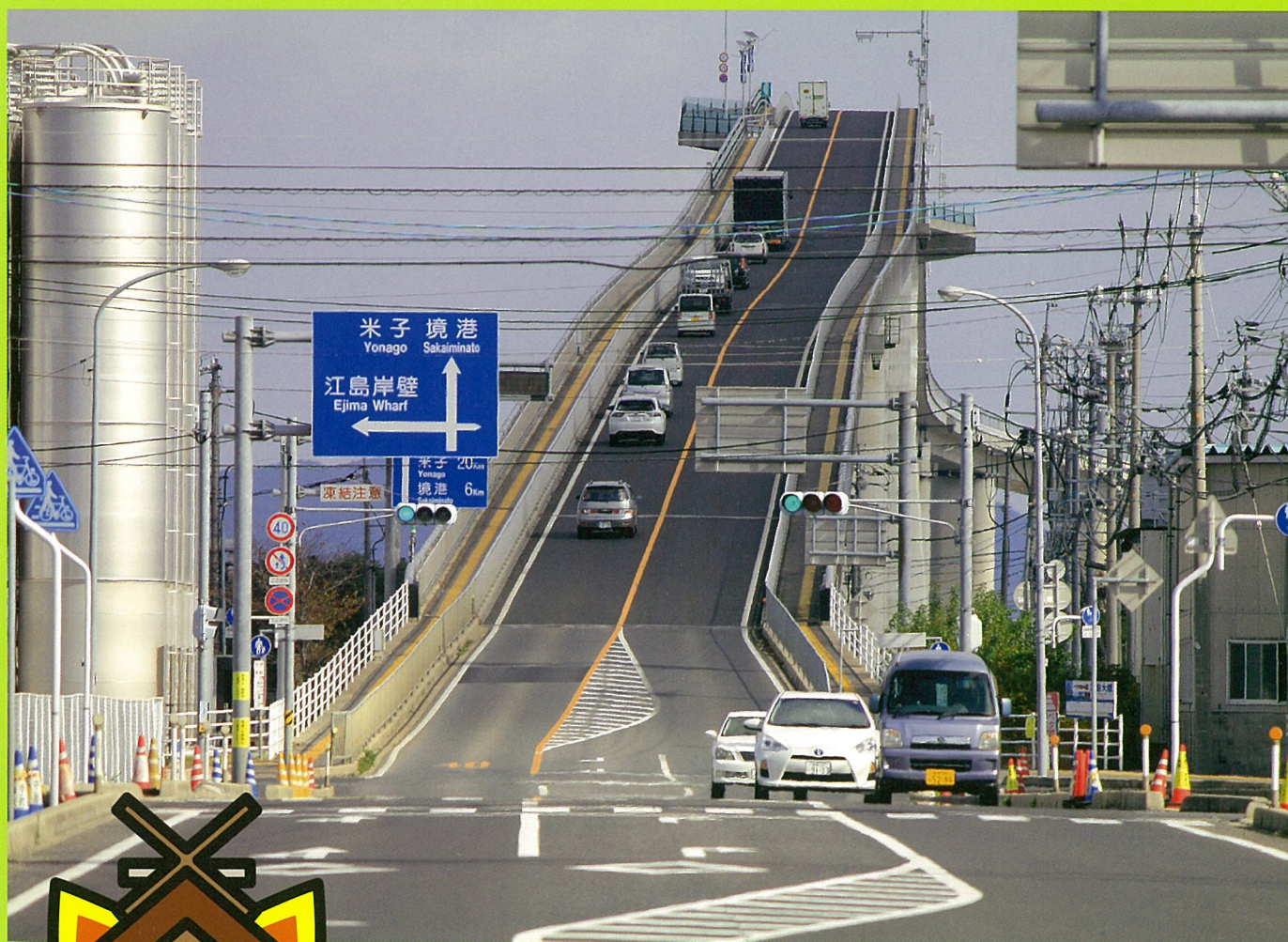
江島大橋(ベタ踏み坂)