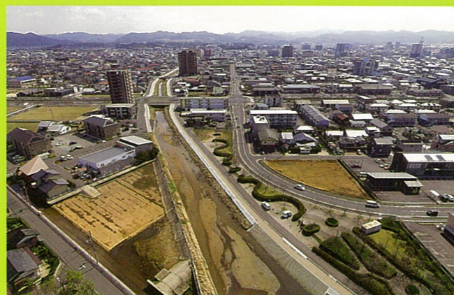
新内藤川【堤防舗装工】(出雲市)