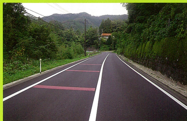
玉湯吾妻山線(雲南市)